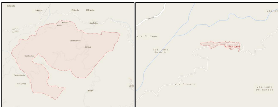
Figura 1. Localización Municipio de Colon – Nariño y del Corregimiento Villanueva.

El corregimiento de Villanueva es uno de los más grandes corregimientos después de la cabecera municipal Génova, del cual hacen parte las veredas de Bellavista, Guaitarilla, La Primavera, Loma Del Ganado, Loma De Ortiz, El Llano, Buesaco, Alto Villanueva, El Helechal, Cujacal y el centro poblado de Villanueva, en la agricultura el cultivo que predomina es el café alternado con el plátano y el banano, cultivos como la caña son sembrados en menor proporción y en su gran mayoría para el consumo familias, de igual manera cultivos de transición son los que tienen las familias durante el transcurso del año, mientras llega la cosecha, la cosecha se hace los meses de marzo, abril y mayo según las variaciones climáticas, su gente es muy trabajadora y orgullosa de su corregimiento de su municipio 1 .