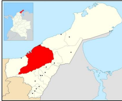
Figura 1 – Localización General Municipio de Riohacha – Guajira