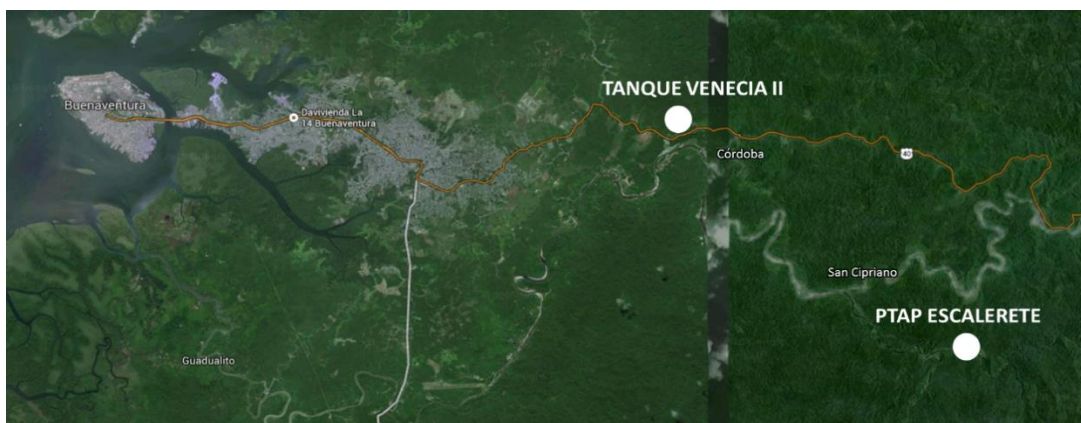
Figura No. 2 – Localización de la PTAP Escalerete

La Planta de Tratamiento de Agua Potable de Escalerete, se encuentra localizada en el área rural del Distrito de Buenaventura (Valle del Cauca), dentro de la reserva natural de San Cipriano. Para acceder al sitio, inicialmente se debe llegar al centro poblado de “Córdoba” por la vía Buenaventura-Cali, posteriormente se debe tomar transporte por vía férrea hasta el centro poblado de San Cipriano y desde ahí, subir 6 km aproximadamente hasta la planta de Escalerete por medio de un tractor o en motos de la misma comunidad del sector ya que no hay entrada de vehículos (camionetas, carros, volquetas, etc.) al sitio donde está ubicada la planta. No hay acceso directo de vehículos a la zona de la planta de tratamiento de Escalerete PTAP, como se aprecia en la Figura No. 2.