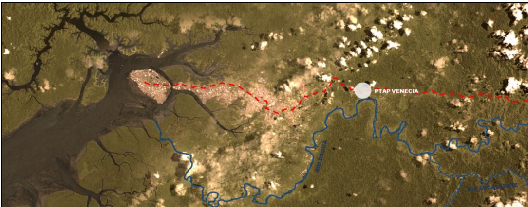
Figura No. 3 – Localización de la PTAP Venecia

La Planta de Tratamiento de Agua Potable Venecia, queda ubicada en la vía Loboguerrero-Buenaventura a la altura del corregimiento de Córdoba como se puede apreciar en la Figura No. 3