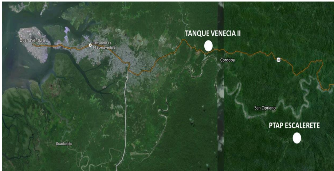
Figura No. 2 – Localización de la PTAP Escalerete

La altitud en la zona insular está en 2 metros sobre el nivel del mar, la PTAP Escalerete se encuentra aproximadamente a una altitud de 155 m.s.n.m. y la PTAP Venecia está en la cota de 102 m.s.n.m.