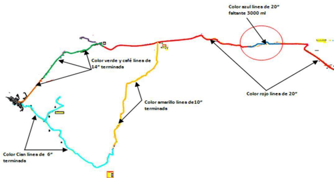
Figura 1: Esquema de proyecto sistema acueducto Regional del Norte del Cauca

Esquema del proyecto: sistema acueducto Regional del Norte del Cauca: