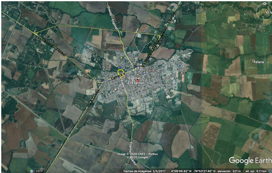
Figura 1 – Localización general municipio de El Espinal y lote tuberías

Con el Municipio de San Luis: partiendo desde el cerro La Ventana se sigue en dirección general noroeste hasta su terminación en el Río Coello.