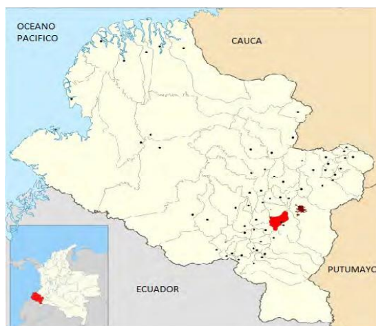
Figura 1. Mapa de ubicación del Municipio de Yacuanquer - Departamento de Nariño

La ejecución del proyecto se realizará en el Municipio de Yacuanquer, un municipio colombiano ubicado en el departamento de Nariño.