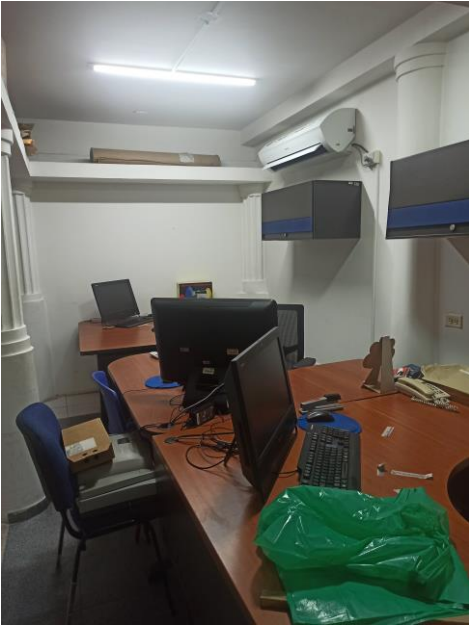
Foto 10. Espacio de oficina