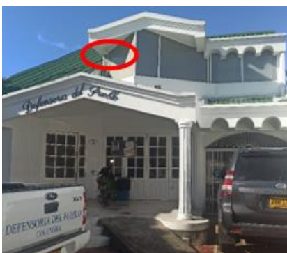
Foto 2. Fachada