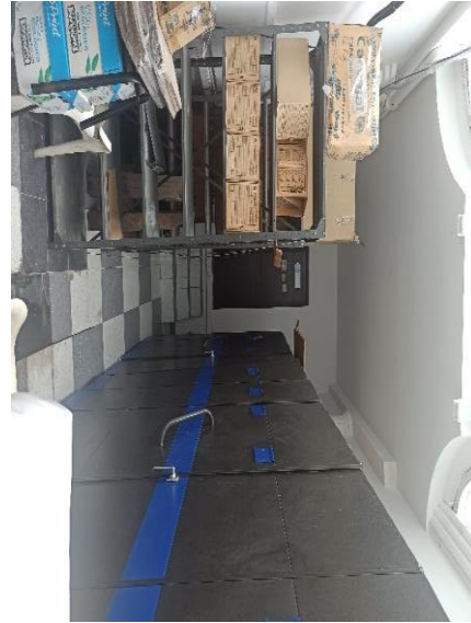
Foto 5. Garaje de la sede