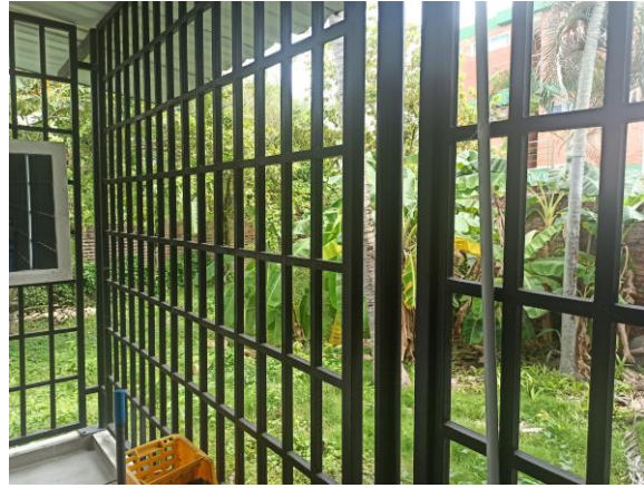
Foto 14. Patio

El patio tiene un área de 250mts cuadrados. Se puede construir el auditorio y archivo en esta zona. Adicional se puede construir el despacho del defensor regional con espacio para sala de juntas.