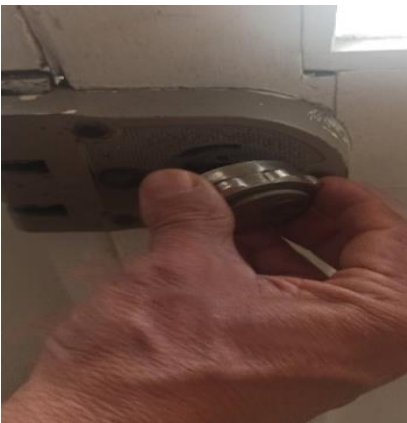
Foto 8. Chapa de puerta de ingreso dañada