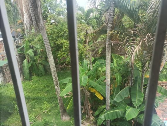
Foto 13. Patio