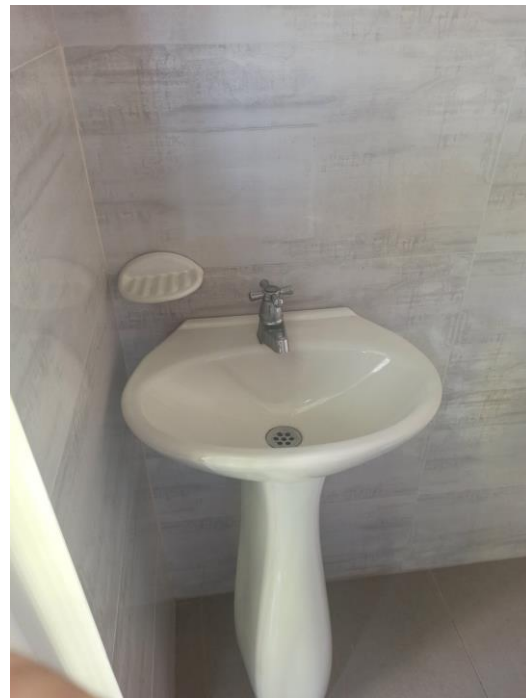
Foto 16. Baños