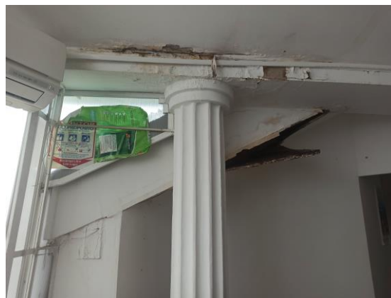
Foto 3. Humedad al interior

La zona señalada tiene una filtración de agua considerable y los murciélagos se hacen en este punto