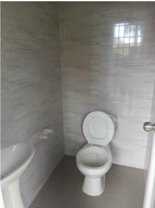
Foto 15. Baños

El patio tiene un área de 250mts cuadrados. Se puede construir el auditorio y archivo en esta zona. Adicional se puede construir el despacho del defensor regional con espacio para sala de juntas.