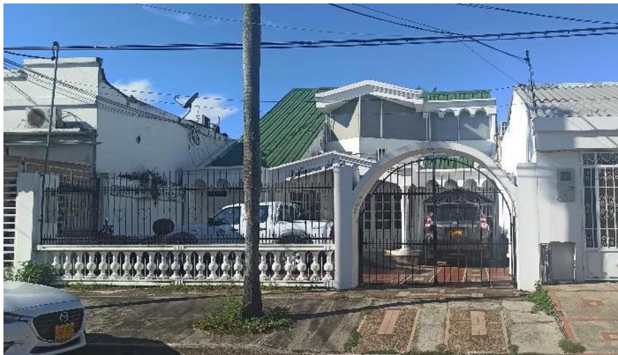
Foto 1. Fachada principal – las dos camionetas las parquean en el antejardín.

Chapas de la puerta principal no funcionan