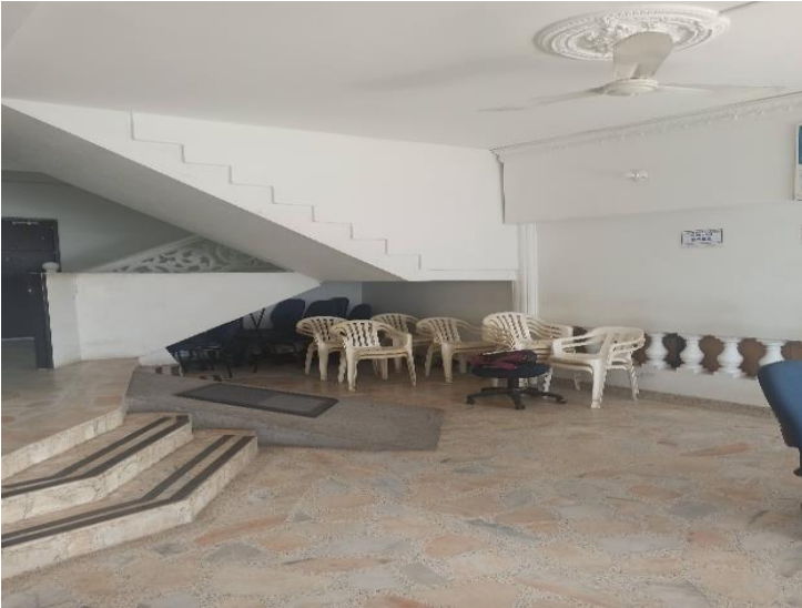
Foto 7. Zona de atención al usuario