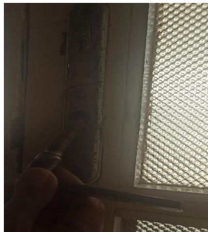
Foto 9. Manija de puerta de ingreso dañada