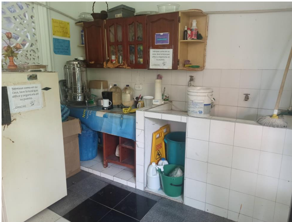
Foto 12. Se hace necesario separar el cuarto de aseo de la cocineta y remodelar la cocineta.

Foto 11: La sede no cuenta con el switch especificado por el grupo de TIC's, la ups está dañada desde hace varios años.