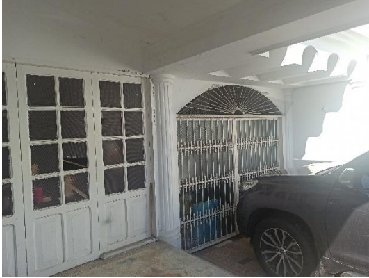
Foto 4. Puerta de ingreso al garaje