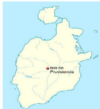
Isla de Providencia (Isla de Providencia)

Las obras se ejecutarán al interior del Aeropuerto El Embrujo de la isla de Providencia.