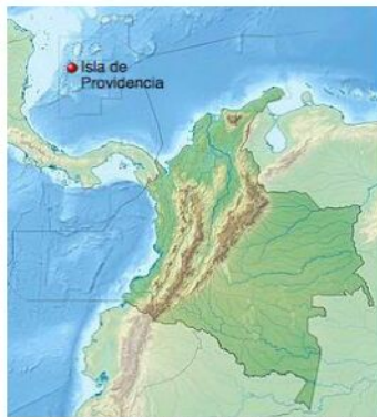
Localización de Isla de Providencia en Colombia

La Isla de Providencia, conocida también como Old Providence, es una isla del Mar Caribe de 17 km 2 que pertenece al departamento colombiano de San Andrés, Providencia y Santa Catalina. Junto a la isla de Santa Catalina y a algunos territorios insulares circundantes conforman el municipio de Providencia y Santa Catalina Islas.