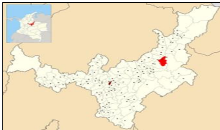
Imagen 5. Localización del municipio de Socha, en el departamento de Boyacá

El municipio de Socha se localiza en la provincia de Valderrama en el departamento de Boyacá, en la zona centro-oriental del país, sobre la cordillera oriental. En la jurisdicción de este municipio se encuentra el área más grande del Parque nacional natural Pisba, así como su principal ruta de acceso. Limita al norte con Sativasur, al sur con Tasco, al oriente con Socotá y al occidente con Paz de Río y Tasco. A él se puede acceder desde la ciudad de Tunja, a lo largo de 117 Km por la vía pavimentada que conduce a Paz de Río, y desviando desde allí hacia Socha, en una longitud de 10 Km.