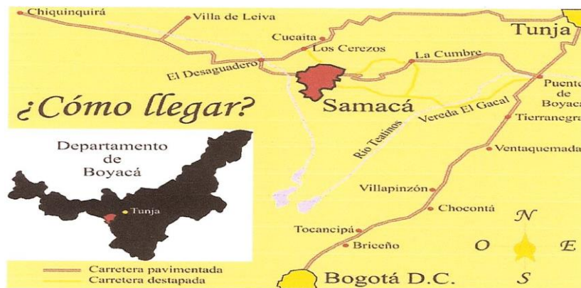
Imagen 2. Localización Especifica del municipio de Samacá, en el departamento de Boyacá

Según la información aportada por el municipio de Samacá, el distrito de Riego Teatinos cuenta con concesión de aguas superficiales, sobre el canal Teatinos, expedida mediante Resolución No 097 de CORPOCHIVOR y 0888 del 16 de marzo de 2016 de CORPOBOYACÁ, la cual debe ser analizada y verificada por el Consultor, con el fin de establecer las condiciones particulares de la misma e identificar su posible uso dentro del proyecto.