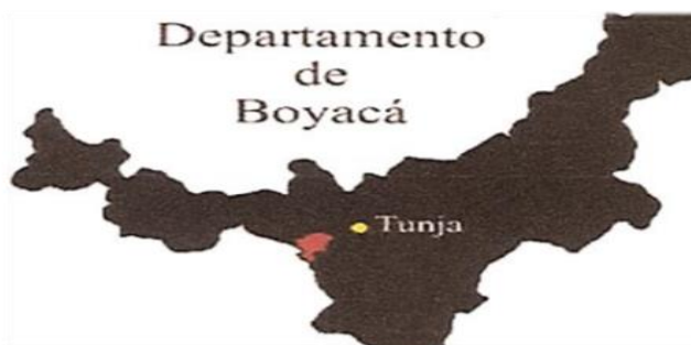
Imagen 1. Localización del municipio de Samacá, en el departamento de Boyacá

Samacá está ubicado en el ramal de la cordillera Oriental, es un municipio de aproximadamente 160 km 2 , tiene una temperatura que varía de 12 °C a 16 °C y una precipitación media anual de 871 mm.