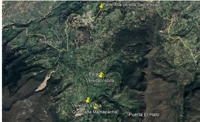
Imagen 6. Localización veredas y cabecera municipal

Abajo, las cuales conforman una red de poca importancia, al oeste con la divisoria de aguas de las Quebradas La Chapa, Carbonera, Landinez y Guaza en los límites con el Municipio de Tasco.