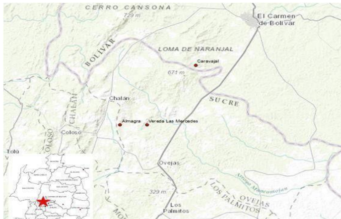
Imagen 1. Localización zona Caravajal, corregimiento del Hobo, municipio de Carmen de Bolívar – Bolívar

Entre las características principales tenemos: extensión total 954 km 2 , extensión área urbana 45,8 km 2 , extensión área rural 947 km 2 , altitud de la cabecera municipal 152 msnm y temperatura media 29 °C.