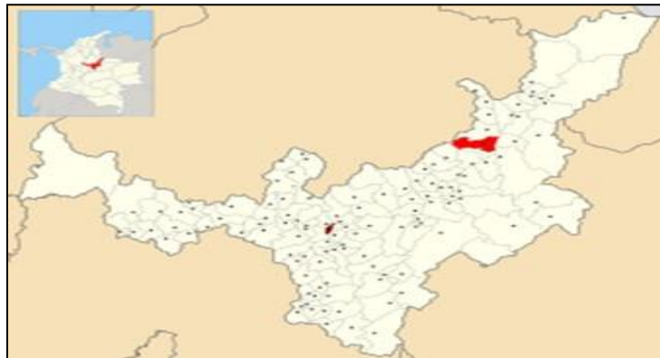
Imagen 3. Localización del municipio de Sativanorte, en el departamento de Boyacá

El municipio de Sativanorte se localiza en la provincia del Norte en el departamento de Boyacá, en la zona centro-oriental del país, sobre la cordillera Oriental, en la hoya hidrográfica del Río Chicamocha, y limita al norte con Susacón, al sur con Sativasur y Tutazá, al oriente con Jericó y Socotá y al occidente con Tutazá y Onzaga (Santander).