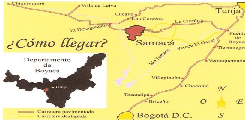
Imagen 2. Localización Específica del municipio de Samacá, en el departamento de Boyacá