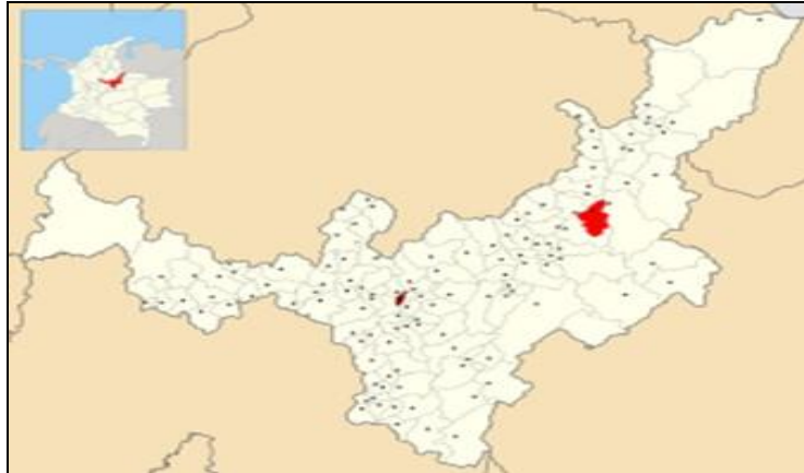
Imagen 5. Localización del municipio de Socha, en el departamento de Boyacá