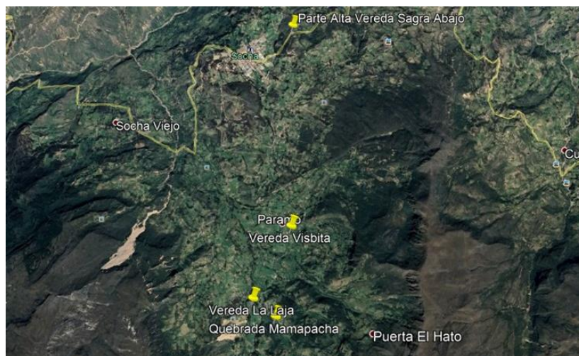
Imagen 6. Localización veredas y cabecera municipal

El punto de abastecimiento se localiza a una distancia aproximada de 8 Km de la cabecera municipal, sobre la quebrada El Tirque, en el sitio llamado Puente Cacique; sobre una cota aproximada de 3000 msnm. Su cuenca hidrográfica tiene una superficie aproximada de 7407 Has, y limita al este con la microcuenca de Cómeza, al norte con la divisoria de aguas que comprende las redes de drenaje de las Veredas El Alto, Sagra Abajo, las cuales conforman una red de poca importancia, al oeste con la divisoria de aguas de las Quebradas La Chapa, Carbonera, Landinez y Guaza en los límites con el Municipio de Tasco.