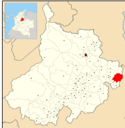
Figura 3. Localización proyecto Audatrér – Carcasí