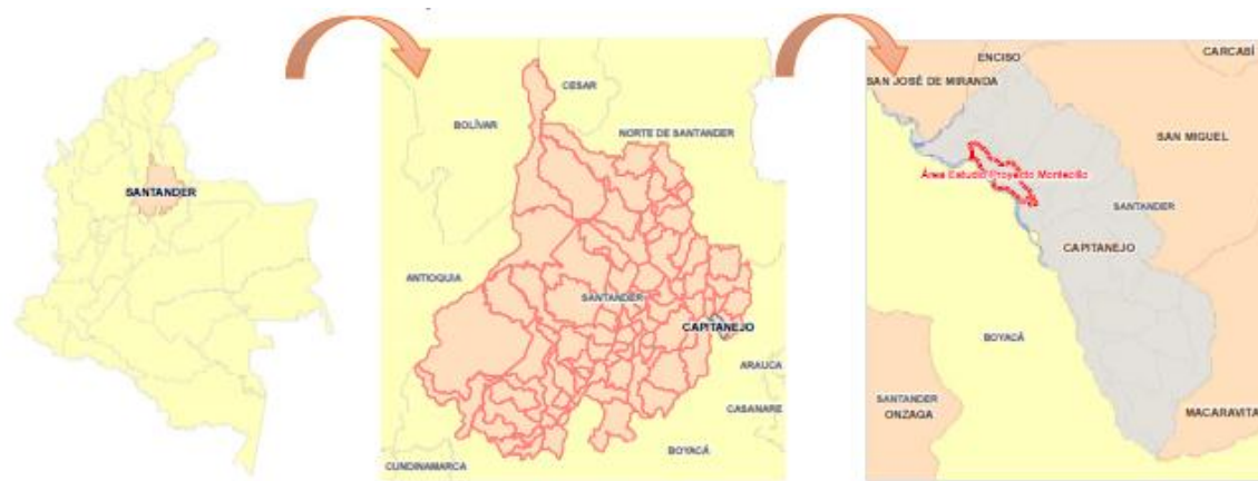
Figura 1. Localización proyecto Montecillo – Capitanejo.

El área potencial por beneficiar con el futuro distrito de adecuación de tierras equivale a 240 ha, distribuidas en 52 predios aproximadamente que representa 47 posibles beneficiarios.