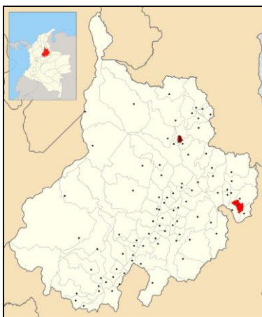
Figura 2. Localización proyecto Asudirarpi – San Miguel

La extensión total del proyecto es de 396.25 ha, que comprende 117 predios que representan a 468 posibles beneficiarios. De esta área, se adecuarán 200 ha netas con obras de riego.