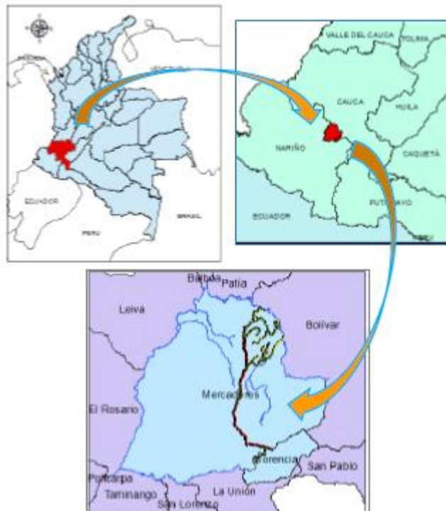
Figura 5. Localización proyecto Asocajamarca

Contempla las veredas de El Cucho y Canchalagro del Corregimiento de Esperanza del municipio de Florencia; las veredas de Pacho el Arbolito, Casafría, Cantollano, Marquillos del Corregimiento de Mercaderes y las veredas de Contador, Caja Marca, Medios, puerta Vieja, Patangejo del Corregimiento de Cajamarca del municipio de Mercaderes. Con el proyecto se pretende beneficiar 420 familias, en un área de 499 hectáreas.