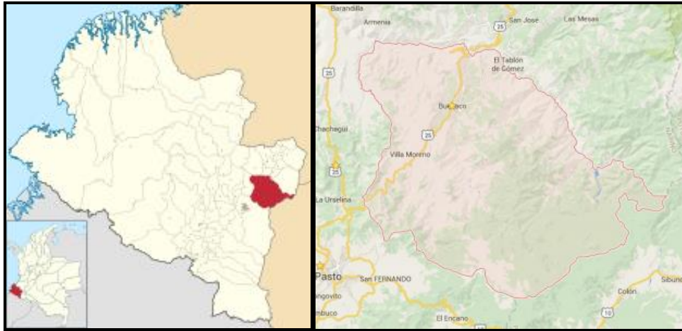
Figura 3. Localización proyecto Ijagui