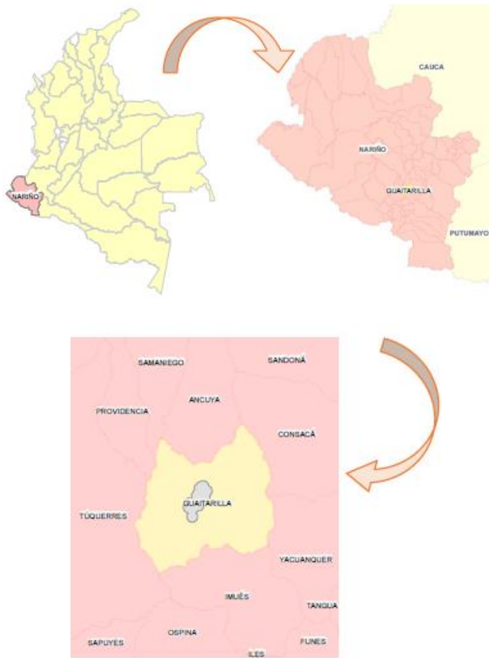
Figura 2. Localización proyecto San Antonio