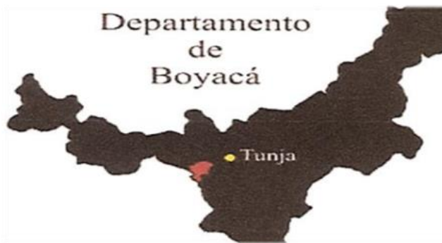
Imagen 1. Localización del municipio de Samacá, en el departamento de Boyacá

Samacá está ubicado en el ramal de la cordillera Oriental, es un municipio de aproximadamente 160 km 2 , tiene una temperatura que varía de 12 °C a 16 °C y una precipitación media anual de 871 mm.