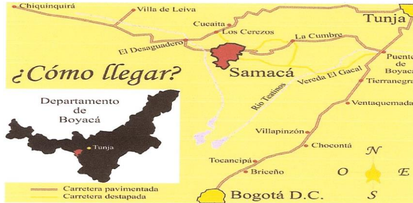
Imagen 2. Localización Especifica del municipio de Samacá, en el departamento de Boyacá