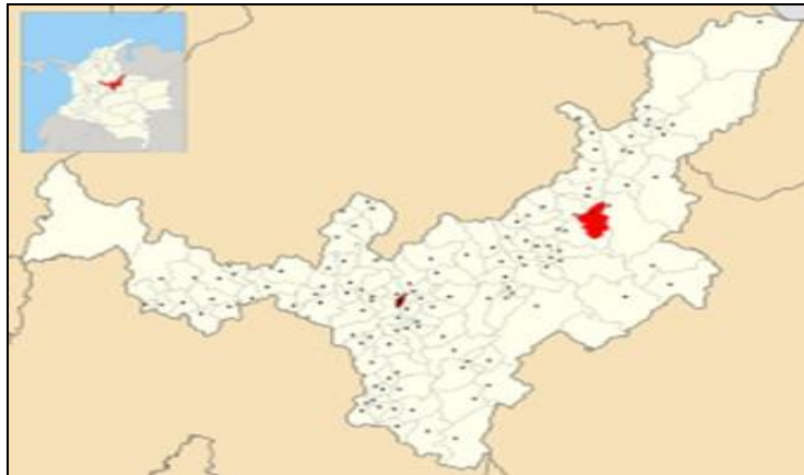
Imagen 5. Localización del municipio de Socha, en el departamento de Boyacá