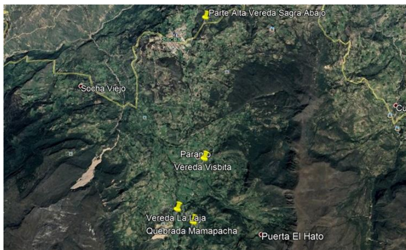
Imagen 6. Localización veredas y cabecera municipal

El punto de abastecimiento se localiza a una distancia aproximada de 8 Km de la cabecera municipal, sobre la quebrada El Tirque, en el sitio llamado Puente Cacique; sobre una cota aproximada de 3000 msnm. Su cuenca hidrográfica tiene una superficie aproximada de 7407 Has, y limita al este con la microcuenca de Cómeza, al norte con la divisoria de aguas que comprende las redes de drenaje de las Veredas El Alto, Sagra Abajo, las cuales conforman una red de poca importancia, al oeste con la divisoria de aguas de las Quebradas La Chapa, Carbonera, Landinez y Guaza en los límites con el Municipio de Tasco.