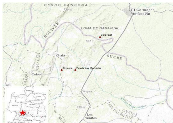
Imagen 2. Localización corregimiento de Almagra, municipio de Ovejas – Sucre

Los límites del municipio están conformados por los municipios de El Carmen de Bolívar, San Pedro y parte de Los Palmitos, Córdoba en el departamento de Bolívar y Chalan junto a Coloso, constituyen los límites circunvalares en el norte, sur, oriente y occidente, respectivamente.