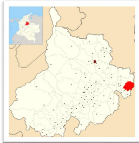
Figura 3. Localización proyecto Audatrér – Carcasí

La extensión total del proyecto es de 639,5 ha, de esta área se adecuaron 72 ha netas con obras de riego, el número de predios potencialmente beneficiados es de 71 con 93 posibles beneficiarios