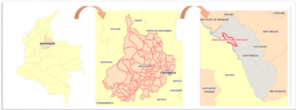
Figura 1. Localización proyecto Montecillo – Capitanejo.