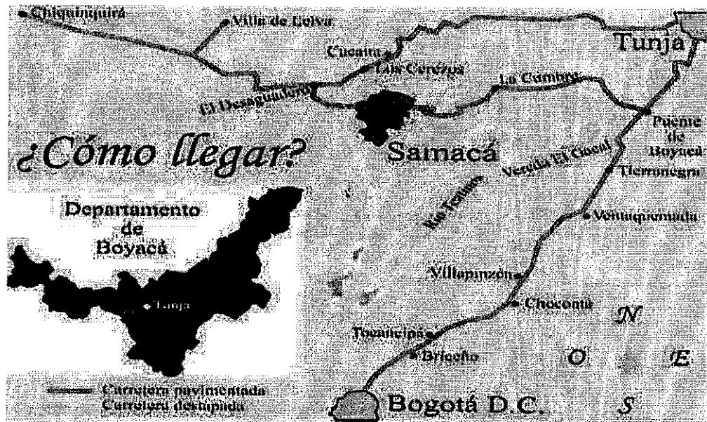
Imagen 2. Localización Específica del municipio de Samacá, en el departamento de Boyacá

Según la información aportada por el municipio de Samacá, el distrito de Riego Teatinos cuenta con concesión de aguas superficiales, sobre el canal Teatinos, expedida mediante Resoluciones Nos. 097 de CORPOCHIVOR y 0888 de CORPOBOYACÁ del 16 de marzo de 2016, concesión que debe ser analizada y verificada por el Consultor, con el fin de establecer las condiciones particulares de la misma e identificar su posible uso dentro del proyecto.