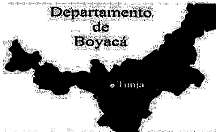
Imagen 1. Localización del municipio de Samacá, en el departamento de Boyacá

CLÁUSULA TRIGÉSIMA PRIMERA- LUGAR DE EJECUCIÓN: El municipio de Samacá se localiza en la provincia del Centro en el Departamento de Boyacá. Limita por el oriente con Cucaita, Tunja y Ventaquemada; por el Occidente con Raquira; por el Norte con Sachicá, Sora y Cucaita, y por el Sur con Ventaquemada, Raquira y Guachetá (Cundinamarca). Dista 32 km desde la ciudad de Tunja y 159 km de Bogotá. Samacá está ubicado en el ramal de la cordillera Oriental, es un municipio de aproximadamente 160 km 2 , tiene una temperatura que varía de 12 °C a 16 °C y una precipitación media anual de 871 mm.