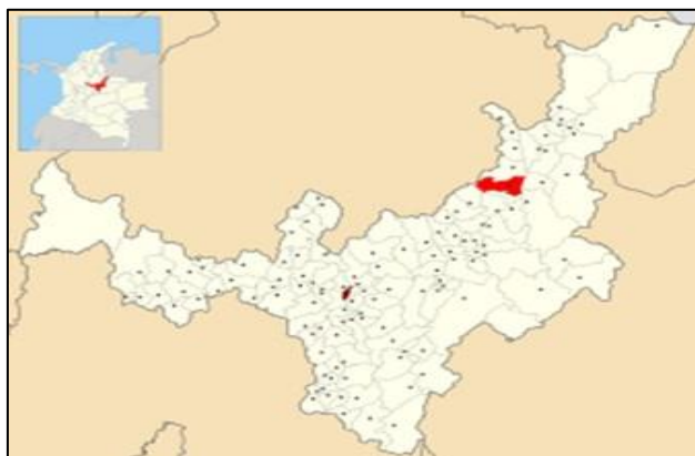
Imagen 1. Localización del municipio de Sativanorte, en el departamento de Boyacá

El municipio de Sativanorte se localiza en la provincia del Norte en el departamento de Boyacá, en la zona centro-oriental del país, sobre la cordillera Oriental, en la hoya hidrográfica del Río Chicamocha, y limita al norte con Susacón, al sur con Sativasur y Tutazá, al oriente con Jericó y Socotá y al occidente con Tutazá y Onzaga (Santander). Se puede acceder desde la ciudad de Tunja, a lo largo de 129 Km por la vía pavimentada que conduce a Susacón, y desviando desde allí hacia Sativanorte por vía destapada, en su mayor parte, en una longitud de 15 Km.