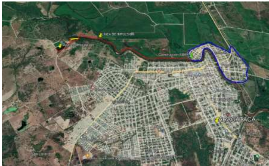
Localización de la EBAR

La zona objeto del proyecto, está situada entre las coordenadas. Latitud 10°31'33.22"N, Longitud 74°11'15.10"O