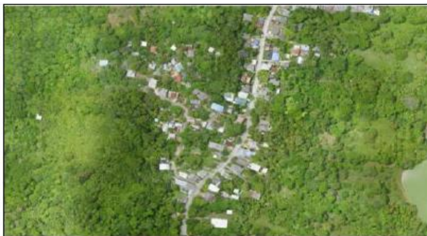
Ilustración 3 Delimitacion y vista panoramica del Sector de Bottom House, San Andres Isla

En las siguientes imágenes se delimitarán los sectores de Bottom House, Schooner Bight, La Paz y las Palmas Nuevo Bosque las cuales son objeto del presente diagnóstico de situación actual.