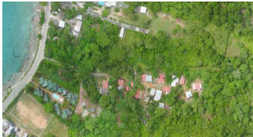
Ilustración 6 Delimitacion y vista panoramica del Sector Las Palmas Nuevo Bosque, San Andres Isla