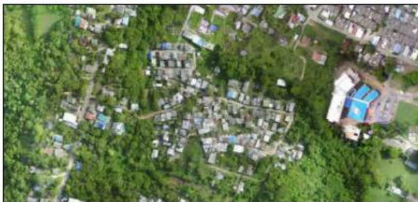
Ilustración 4 Delimitacion y vista panoramica del Sector de Schooner Bight San Andres Isla