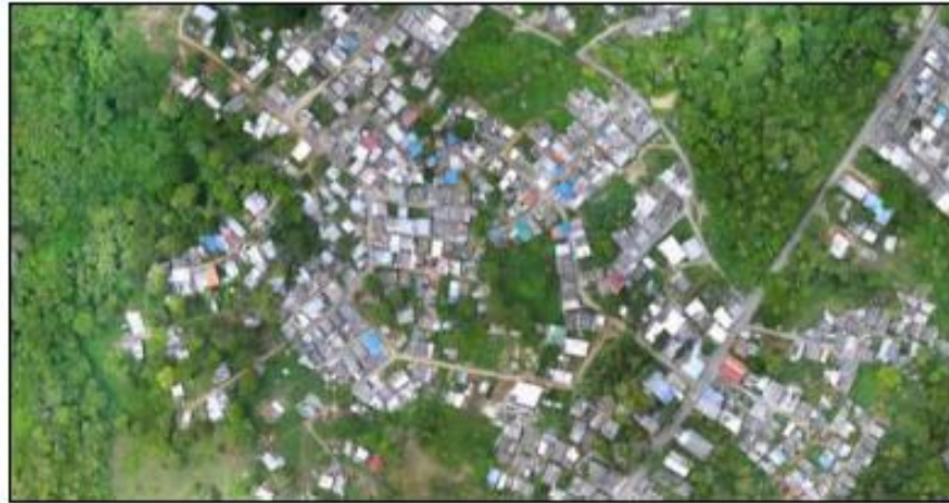
Ilustración 5 Delimitacion y vista panoramica del Sector La Paz, San Andres Isla