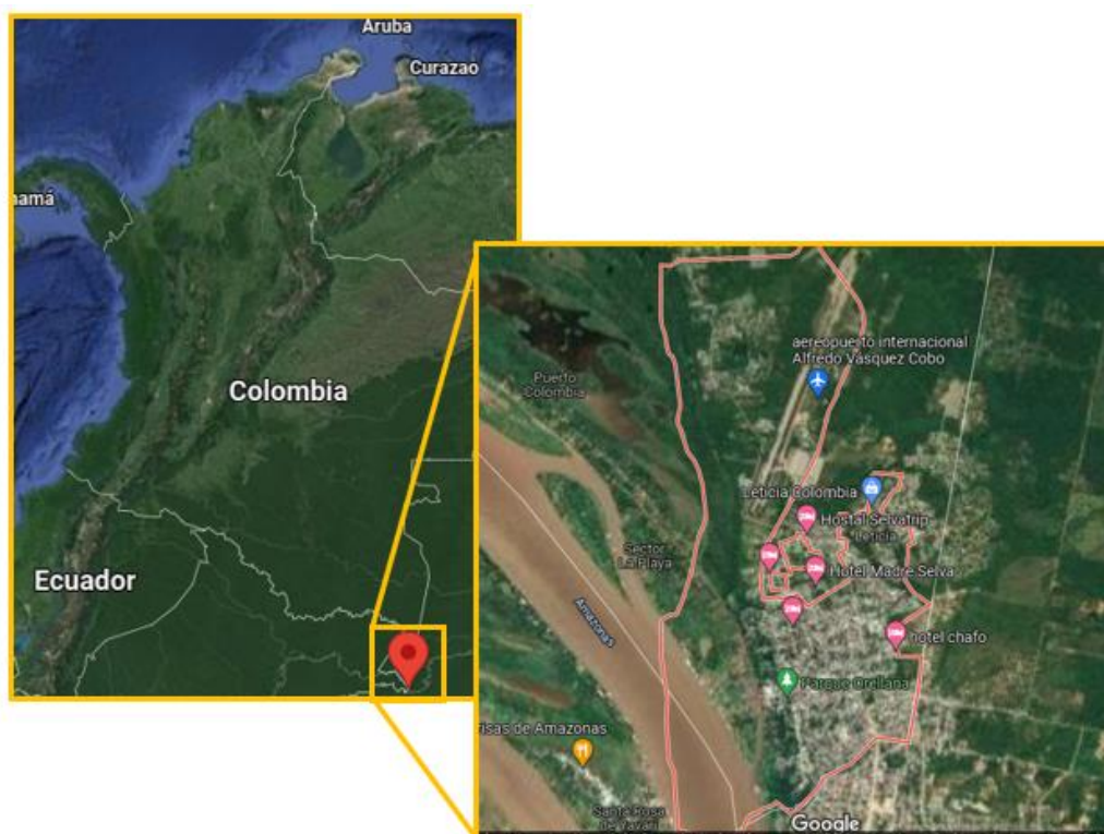
Localización Geográfica del municipio de Leticia

El municipio de Leticia - Amazonas, posee una extensión del área urbana de 5.698 Km 2 , que equivalen al 5,20% de la superficie total del departamento del Amazonas. La cabecera municipal está ubicada a 4° 12'54" de latitud sur y 69°56'28" de longitud Oeste. La altura de la cabecera municipal es de 80 m.s.n.m. y su temperatura media es de 25.4° centígrados. Desde el municipio hasta la capital del departamento hay una distancia de 1.100 Km.