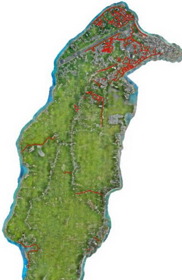
Imagen localización general de sitios de intervención

Los sitios previstos y las redes donde se plantea la intervención de la fase III de renovación de redes se identifica en la siguiente imagen en la cual el trazado rojo representa la convención de las redes de acueducto que se deben intervenir.