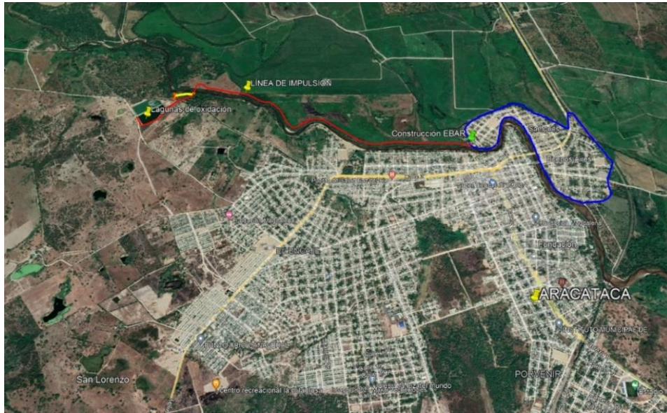
Imagen Localización de la EBAR

La zona objeto del proyecto, está situada entre las coordenadas. Latitud 10°31'33.22" N, Longitud 74°11'15.10" O.