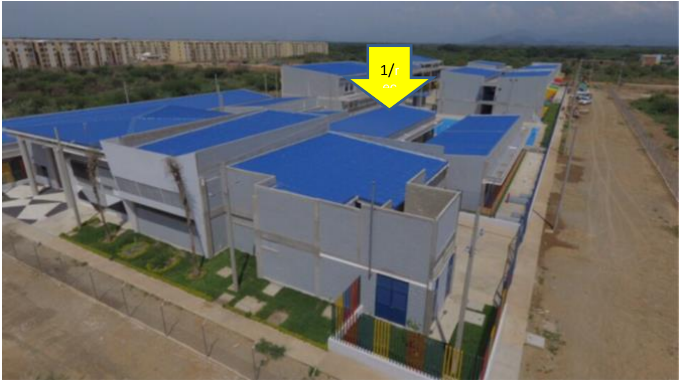
Ilustración 4 Cubiertas del CDI en primer plano

1/ Se recomienda la cubierta interior central, por seguridad de la instalación