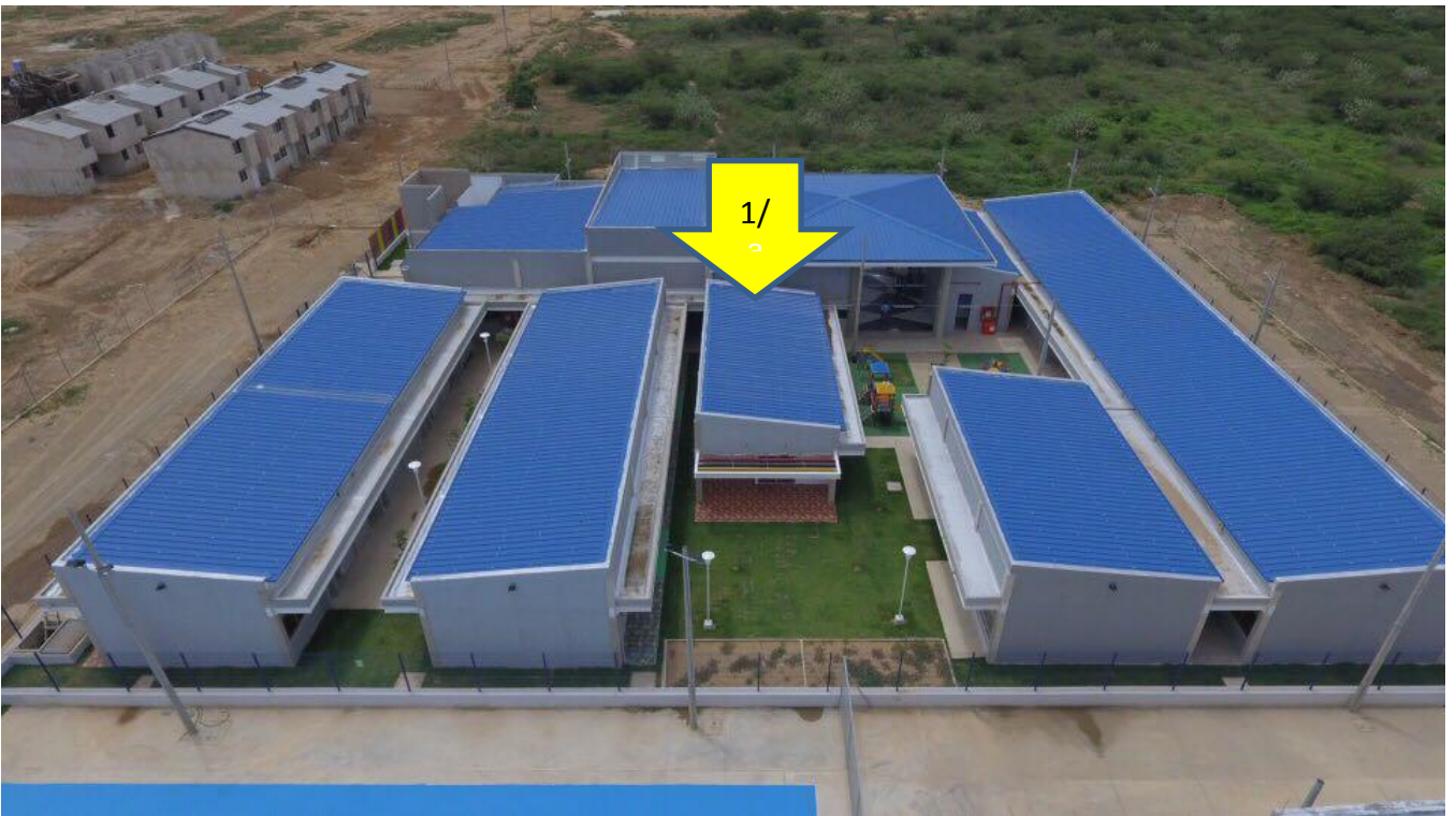
Ilustración 3 Cubiertas del CDI vistas desde el colegio

1/ Se recomienda la cubierta interior central, por seguridad de la instalación