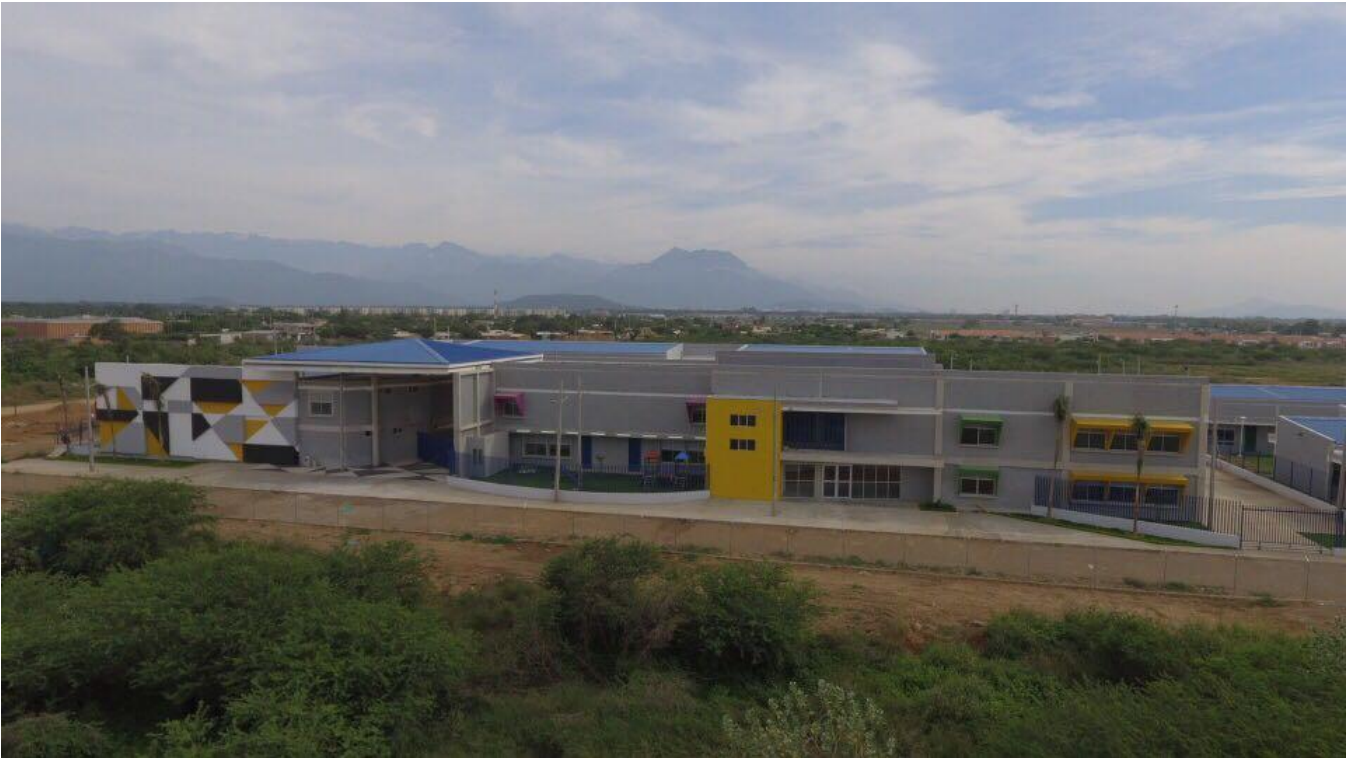
Ilustración 2 Fachada del Colegio Lorenzo Morales. Al lado el CDI

El área de cubiertas disponible para la planta de generación es suficiente para la capacidad mínima esperada (15 kWp). Para mayor precisión y posibilidades de medición y estimación de áreas, ver fotografías y planos anexos de la cubierta de la edificación descrita en el Anexo Técnico.