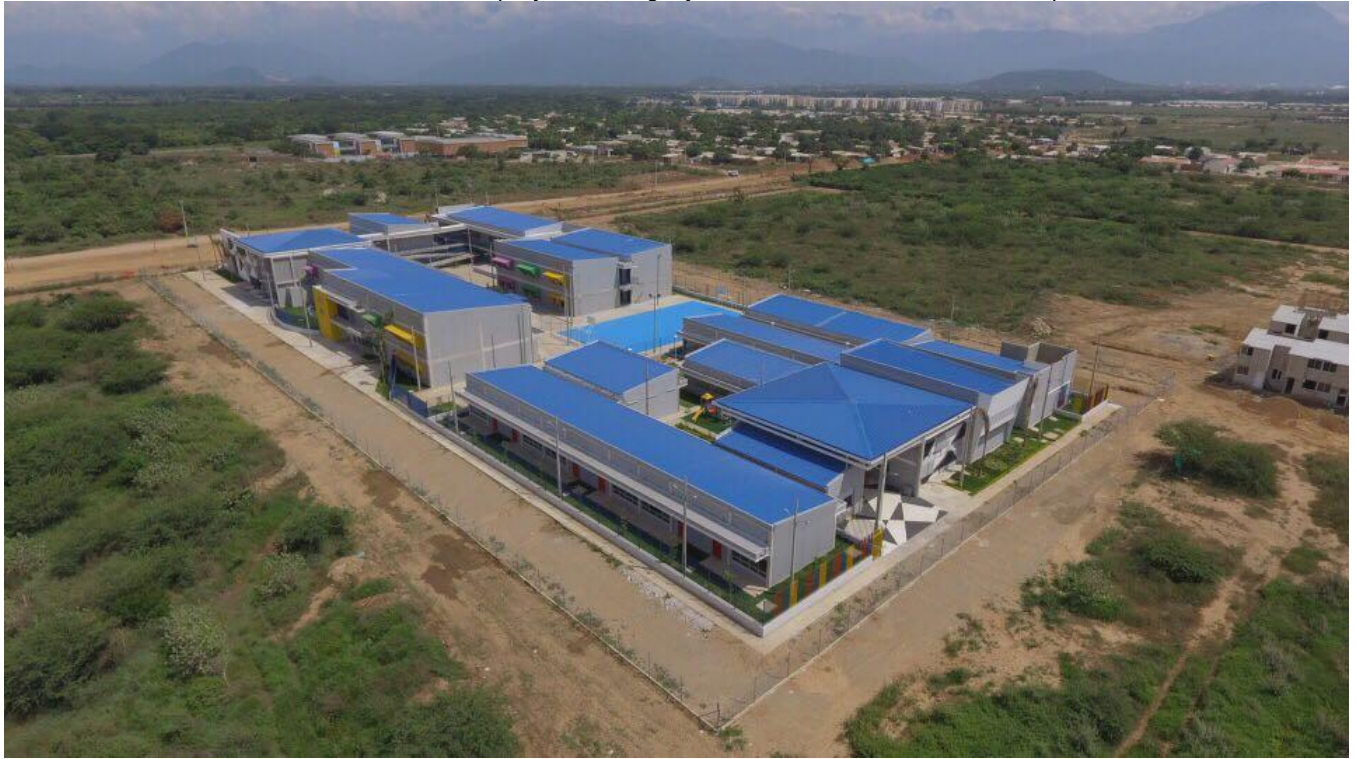
Ilustración 1 Panorámica del proyecto Colegio y CDI Lorenzo Morales en Valledupar

Con este proyecto, Findeter desea incorporar la mayoría de los elementos posibles de la regulación definidos en la Ley 1715 de 2014 y los elementos técnicos que permitan la implementación de este tipo de generación solar fotovoltaica en las edificaciones públicas en diferentes sitios del país. Por esta razón, el proveedor requerirá un conocimiento cercano de la regulación y experiencia en instalaciones en edificaciones públicas y privadas en Colombia.