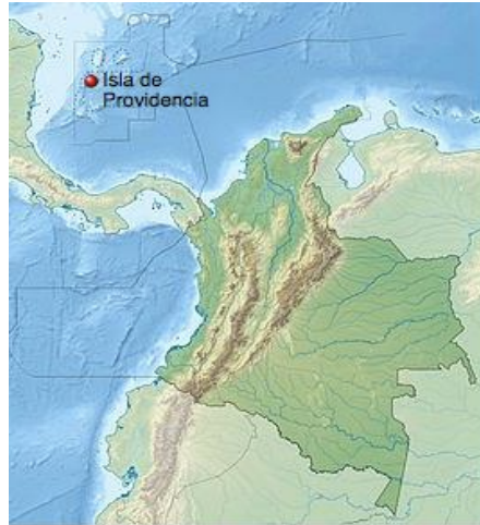
Localización de Isla de Providencia en Colombia