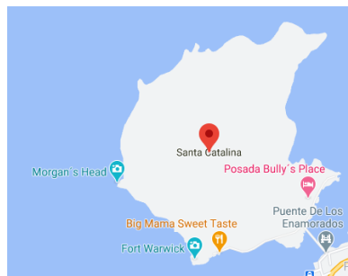
Isla de Santa Catalina