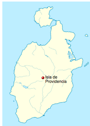
Isla de Providencia (Isla de Providencia)