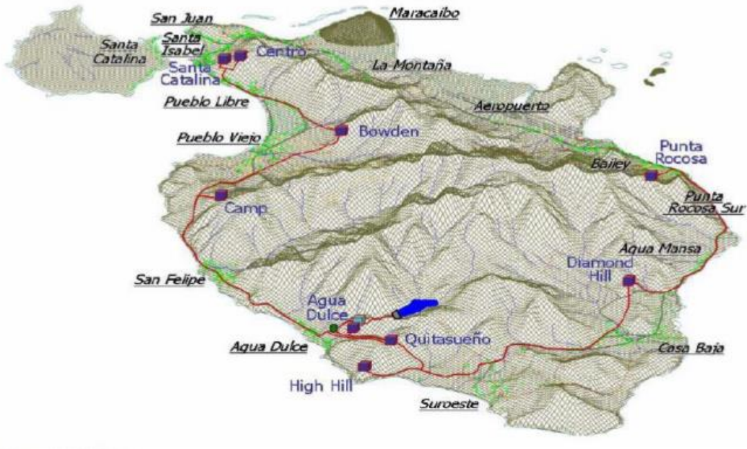
Figura 1 Esquema General del Acueducto de Providencia

Localización embalse Agua dulce